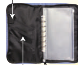
メモやパスポート、通帳、チケット類などの収納に