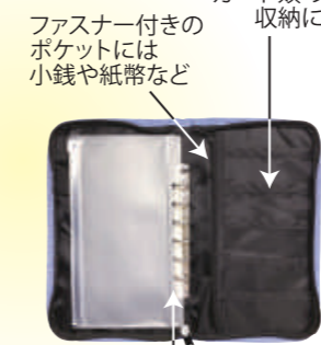
ファスナー付きのポケットには小銭や紙幣など