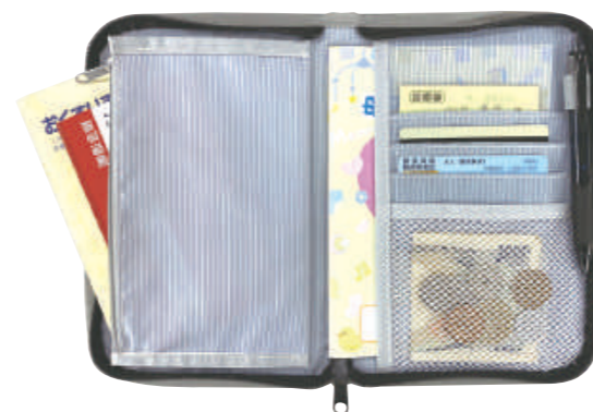
カード～A6・B6サイズまでの色々サイズのポケットがたくさん付いてお薬手帳入れや通帳印鑑ケース、母子手帳入れとして幅広く使用が可能です。

お薬手帳や通帳など、いろいろ入って便利に使える、A6・B6の母子手帳入れとしても最適です