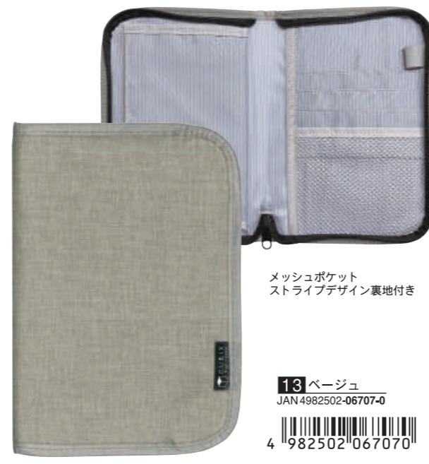
メッシュポケット ストライプデザイン裏地付き