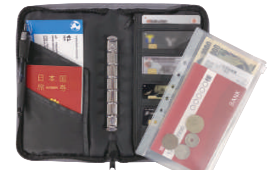
通帳がスッキリ収納できるスライダークースが3枚付き

通帳・パスポート・チケット・カードなどが きっちり収納でき、家計の管理や旅行時の貴重品を まとめるオーガナイザーケースとして最適