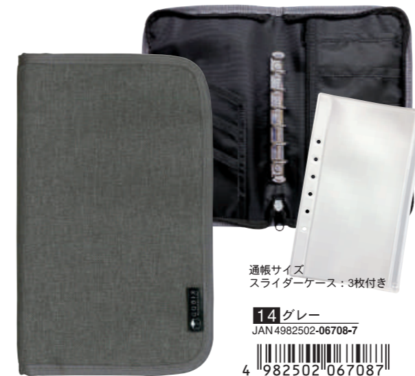
ファスナー付きラウンドジップ形状