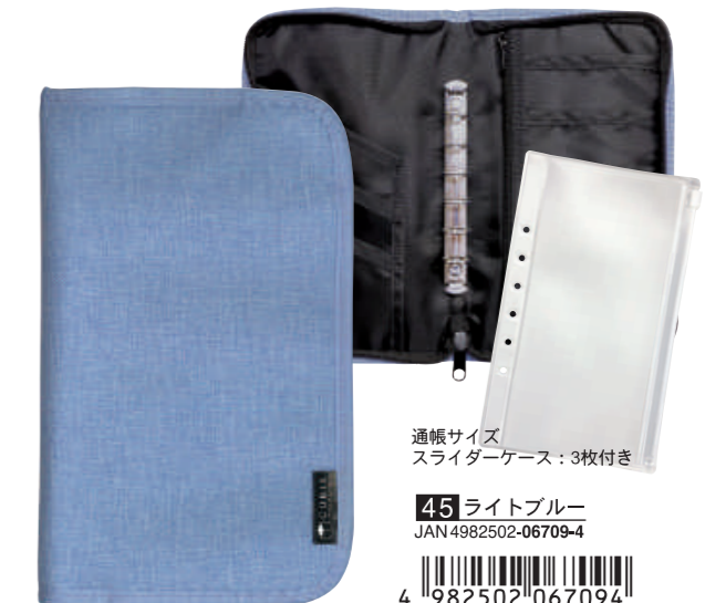
ファスナー付きラウンドジップ形状