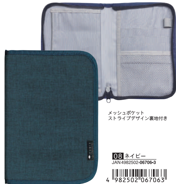
メッシュポケット ストライプデザイン裏地付き